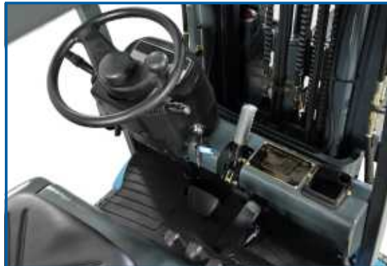
Das Cockpit ist klar und übersichtlich gestaltet. Es bietet viel Platz und Beinfreiheit. Alle Bedienelemente sind leicht zugänglich.

Verschiedene Komfortsitze der Marken GRAMMER®, SAVAS®, KAB®, etc. ergänzen die Auswahlmöglichkeiten. Bitte fragen Sie Ihren HanseLifter Händler.