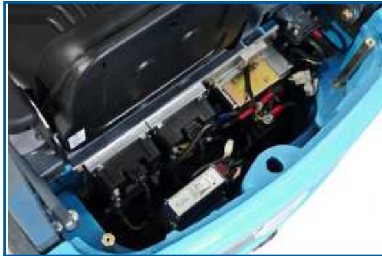
Die Boardelektronik ist leicht zugänglich im Heck des Staplers untergebracht und kontrolliert die drei Motoren

Die Boardelektronik ist, von einer soliden Stahlblechblende verdeckt, im Heck des Staplers montiert und mit wenigen Handgriffen leicht zugänglich.